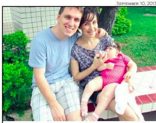
EL FUTURO DE LA HUMANIDAD SE FRAGUA EN LA FAMILIA. – JUAN PABLO II